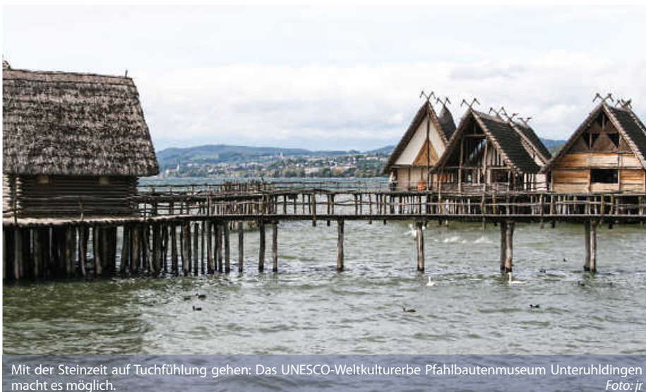
Mit der Steinzeit auf Tuchfühlung gehen: Das UNESCO-Weltkulturerbe Pfahlbautenmuseum Unteruhldingen macht es möglich.

Faszination bietet auch die Besichtigung der prähistorischen Pfahlbauten in Unteruhldingen, ein idealer Tagesausflug. In diesem Freilichtmuseum, das 10.000 Jahre Geschichte einfängt, können die Besucher*innen rekonstruierte Häuser, Werkstätten und Originalfunde aus der Stein- und Bronzezeit entdecken, die interessante Einblicke in einen vergangenen Abschnitt der Menschheitsgeschichte bieten. Egal ob Steinzeitforscher, Naturliebhaber oder Action-Fan – rund um den Bodensee ist einfach für jeden etwas dabei! (smh)