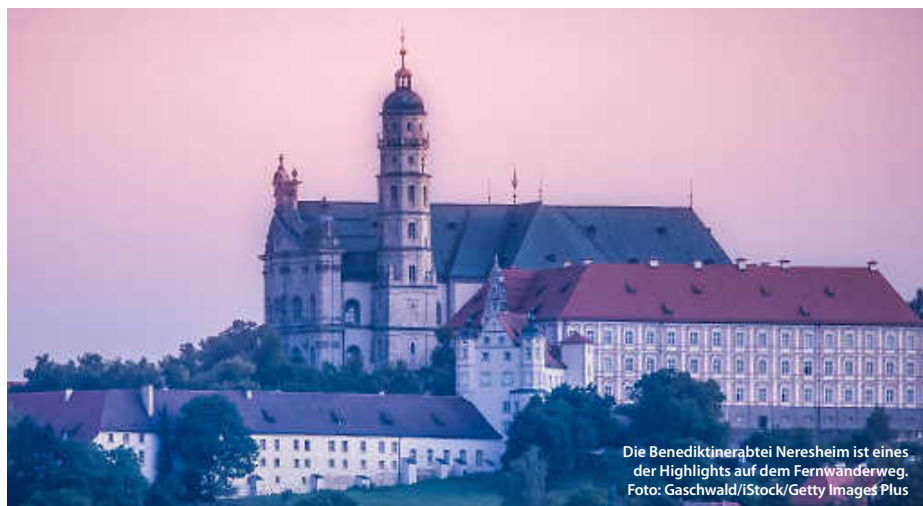
Die Benediktinerabtei Neresheim ist eines der Highlights auf dem Fernwanderweg.

Und natürlich warten überall Schafe: Heute noch bewirtschaftete Schafhöfe, uralte Schaftriebe, die Kultur des Schäferlaufes – sie alle geben spannende Einblicke in die Kultur der Schäfer, die die Region bis heute einzigartig und vor Ort erlebbar machen. (haf/jr)