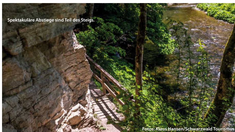
Spektakuläre Abstiege sind Teil des Steigs.

Am Ende macht die Mischung den Reiz des Steigs aus: massive Felswände, enge Pfade, Ursprünglichkeit der Natur, rauschende Flüsse und Wasserfälle, aber ebenso Bergwiesen und imposante Blicke, sowohl in die Ferne (Alpen, Feldberg, Schluchsee) aber auch in die Tiefe der durchwanderten Schluchten. (haf)