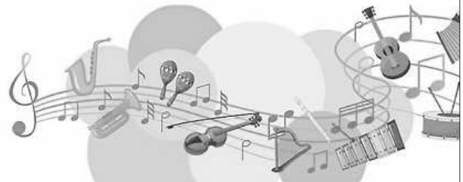
Plakat: Bläserjugend Niederwinden e.V.

{hannaheschle@yahoo.de, Handy: 015257286860}