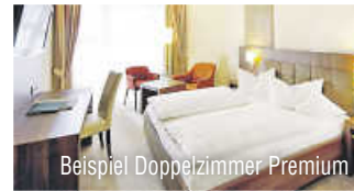
Beispiel Doppelzimmer Premium