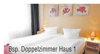
Bsp. Doppelzimmer Haus 1