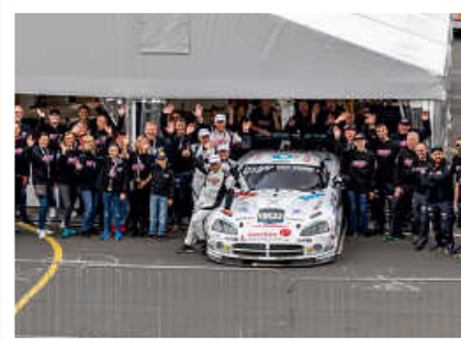
> Mit etwa 50 ehrenamtlichen Helferinnen und Helfern ist White Angel for Fly and Help jedes Jahr Bestandteil des 24h-Rennens am Nürburgring

Jetzt über den QR-Code direkt mit dem Teamchef in Kontakt treten und das Projekt aktiv unterstützen!