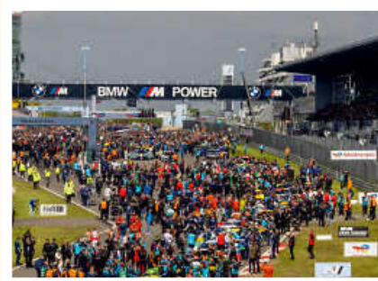
> Zehntausende Fans in der Startaufstellung gehen auf Tuchfühlung mit den Teilnehmern beim 24h-Rennen