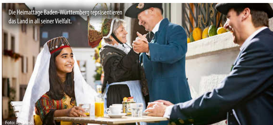
Die Heimattage Baden-Württemberg repräsentieren das Land in all seiner Vielfalt.

Den Abschluss bildet die Verleihung des Landespreises für Heimatforschung am 21. November 2024 in Nattheim. (red)