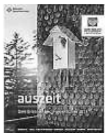
Foto: © ZweiTälerLand Tourismus _ Titelbild „auszeit“ (Clemens Emmeler)

Pünktlich zum Jahresende wurden in der ZweiTälerLand Tourismusgesellschaft (ZTL) die neuesten Marketing-Produkte fertiggestellt: Der neue Erlebnis- und Freizeitführer „auszeit“, der ZweiTälerSteig Image-Flyer, ein Info-Flyer in französischer Sprache sowie jeweils ein kurzer Image-Film zu den fünf ZweiTälerSteig-Etappen.