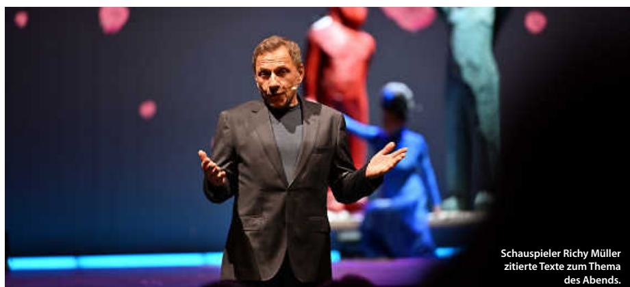
Schauspieler Richy Müller zitierte Texte zum Thema des Abends.