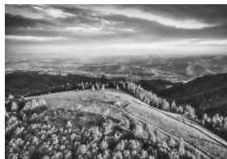
Blick vom Kandel

ZweiTälerLand Elztal & Simonswäldertal www.zweitaelerland.de