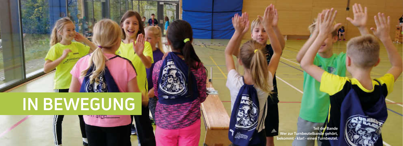
Teil der Bande Wer zur Turnbeutelbande gehört, bekommt - klar! - einen Turnbeutel.