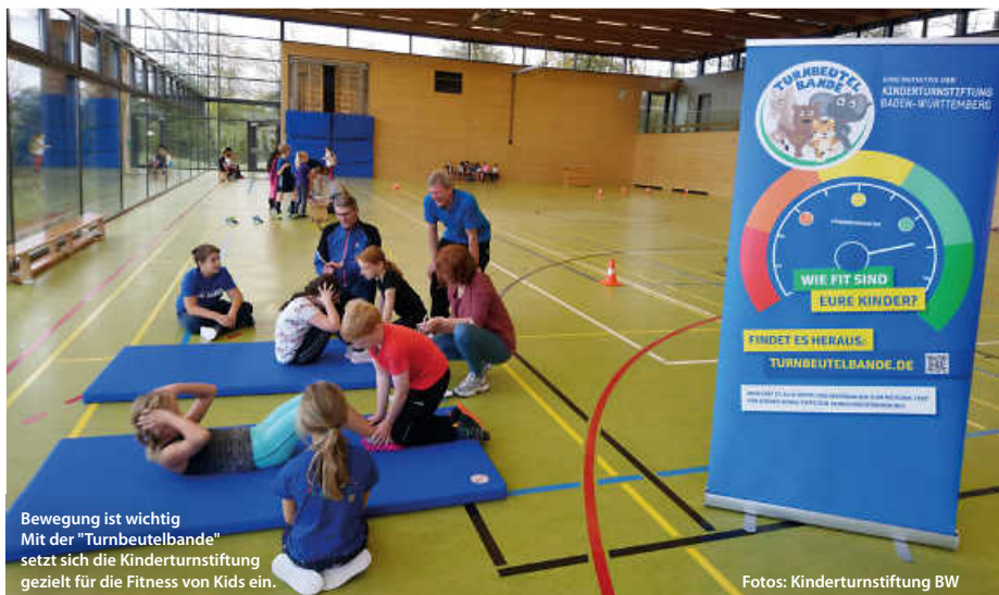
Bewegung ist wichtig Mit der „Turnbeutelbande“ setzt sich die Kinderturnstiftung gezielt für die Fitness von Kids ein.

Übrigens: Für die fünf ersten Kommunen, die den Motorik-Test für Kinder bei sich durchführen wollen, bietet die Kinderturnstiftung Baden-Württemberg eine kostenlose digitale Schulung an. Im Rahmen der etwa zweistündigen Veranstaltung wird der Test vorgestellt und es werden Tipps zur erfolgreichen Organisation und Durchführung gegeben, Kontakt hier: info@turnbeutelbande.de (pm/red)