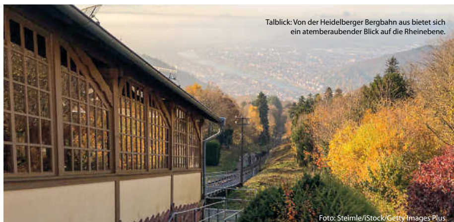
Talblick: Von der Heidelberger Bergbahn aus bietet sich ein atemberaubender Blick auf die Rheinebene.

Baden-Baden ist nicht nur als Kurstadt bekannt, sondern auch für seinen Hausberg, den Merkur. Die Merkurbergbahn führt über eine Länge von 1,2 Kilometern auf den 668 Meter hohen Gipfel. Der Merkururm überragt den Gipfel noch um 23 Meter. Von dort kann man sogar bis zu den Vogesen schauen oder den Gleitschirmfliegern bei den Startvorbereitungen und beim Abheben zusehen. (sh)