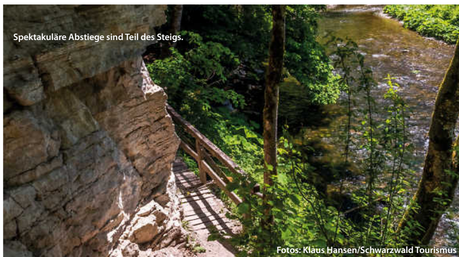
Spektakuläre Abstiege sind Teil des Steigs.

Am Ende macht die Mischung den Reiz des Steigs aus: massive Felswände, enge Pfade, Ursprünglichkeit der Natur, rauschende Flüsse und Wasserfälle, aber ebenso Bergwiesen und imposante Blicke, sowohl in die Ferne (Alpen, Feldberg, Schluchsee) aber auch in die Tiefe der durchwanderten Schluchten. (haf)