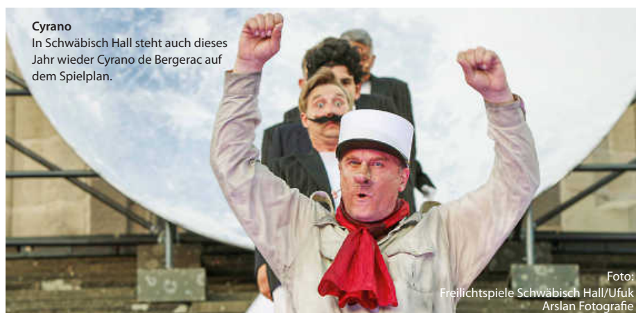
Cyrano In Schwäbisch Hall steht auch dieses Jahr wieder Cyrano de Bergerac auf dem Spielplan.

Doch auch in Jagsthausen, Heidelberg oder Zwingenberg am Neckar locken jedes Jahr Schauspielerinnen und Schauspieler mit spannenden Inszenierungen ein großes Publikum an. Schauen Sie mal vorbei. (jr)