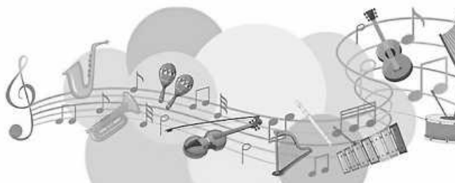
Plakat: Bläserjugend Niederwinden e.V.

( hannaheschle@yahoo.de , Handy: 015257286860)