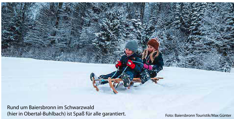
Rund um Baiersbronn im Schwarzwald (hier in Obertal-Buhlbach) ist Spaß für alle garantiert.

... gibt es die Hänge am Feldberg, Kandel oder rund um Todtnau. Hier wird es steil, schnell und aufregend. Größere Kinder werden diese Hänge lieben – vorausgesetzt, Eltern haben starke Nerven und den Kids gute Bremstechnik beigebracht. (jr/red)