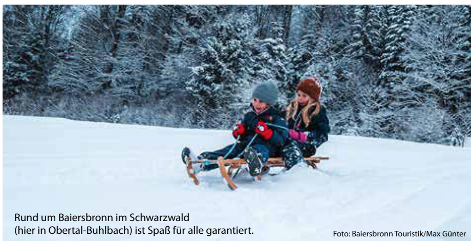
Rund um Baiersbronn im Schwarzwald (hier in Obertal-Bühlbach) ist Spaß für alle garantiert.

... gibt es die Hänge am Feldberg, Kandel oder rund um Todtnau. Hier wird es steil, schnell und aufregend. Größere Kinder werden diese Hänge lieben – vorausgesetzt, Eltern haben starke Nerven und den Kids gute Bremsstechnik beigebracht. (jr/red)