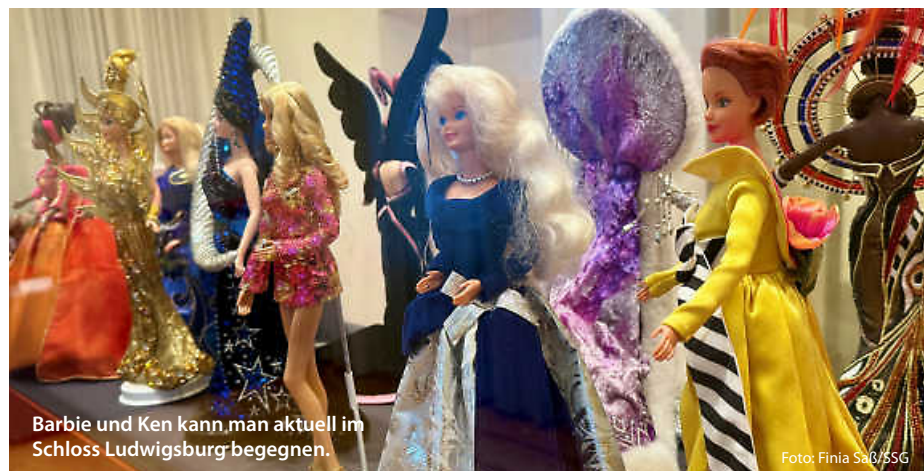
Barbie und Ken kann man aktuell im Schloss Ludwigsburg begegnen.

Jedes Museum bietet nicht nur Spaß für Kids, sondern sorgt auch bei den Älteren für eine kleine Atempause mit dem Gefühl: Hier wird unser Alltag erleichtert. Und das Beste? Viele dieser Einrichtungen haben familienfreundliche Eintrittspreise. Perfekt für einen vollen Tag – ohne, dass am Abend der Geldbeutel stöhnt. Fertig sind 10 Abenteuer, die Lust machen, neue Welten zu entdecken. Also: Wer packt den Rucksack? (ral/jr/red)