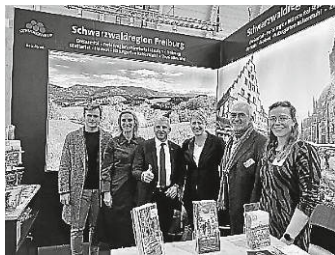
Stand der Schwarzwaldregion Freiburg auf der CMT.