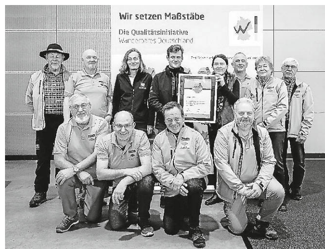
Die ZweiTälerLand-Delegation mit dem Deutschen Wanderverband bei der Urkundenübergabe im Rahmen der CMT

Bei der Vor-Ort-Begehung durch den Deutschen Wanderverband im November vergangenen Jahres, konnte der ZweiTälerSteig erneut die strenge Qualitätsprüfung meistern. Das ZweiTälerLand, welches in Gänze als „Qualitätsregion Wanderbares Deutschland“ ausgezeichnet ist, setzt damit weiter auf Qualität. Die Rezertifizierung erfolgte mit Fördermitteln des Naturparks Südschwarzwald.