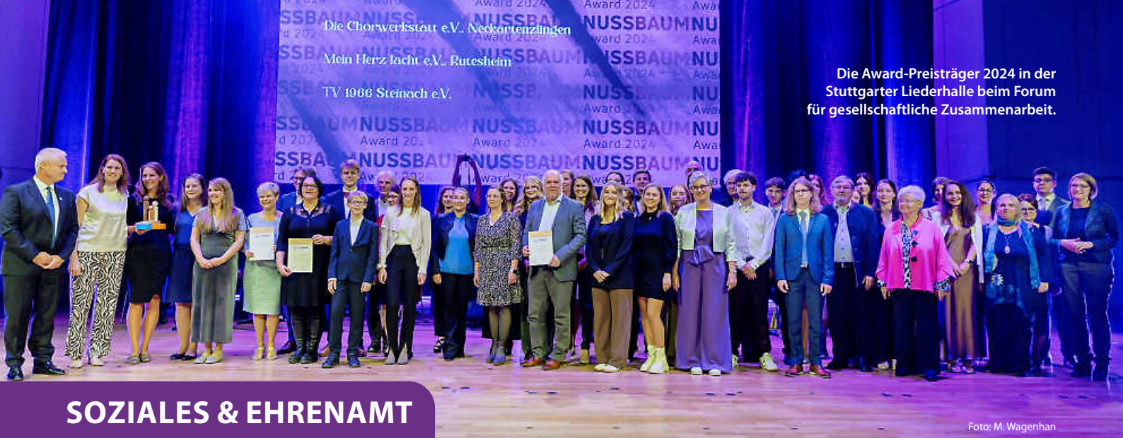
Die Award-Preisträger 2024 in der Stuttgarter Liederhalle beim Forum für gesellschaftliche Zusammenarbeit.