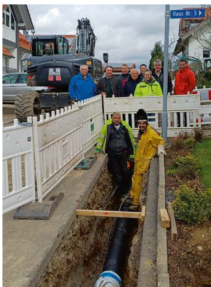
Bild: Die Nahwärmegenossenschaft Winden im Elztal eG hat mit dem Bau des Wärmenetzes „Am Dorfacker“ und „Reschenberg“ begonnen.

Im Zuge der Verlegung der Wärmeleitungen am Reschenberg durch die Nahwärmegenossenschaft Winden im Elztal eG wird die Gemeinde, im Bereich der Mehrzweckhalle bis zur Straße „Am Dorfacker“, eine Wasserleitung (Ringleitung) neu verlegen und den Regenwasserkanal in Höhe des Solischuppen sanieren.