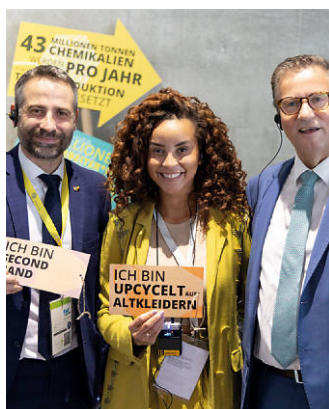
Fair macht den Unterschied

Ohne erhobenen Zeigefinger präsentiert die Fair Handeln