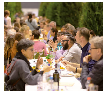
Genießen an der Langen Tafel

Gut, sauber und fair genießen und einkaufen – das geht auf der Slow Food . Ein Highlight ist die Lange Tafel. Hier finden Feinschmeckerinnen und Feinschmecker einen Platz, an dem sie durchatmen, mit Tischnachbarn ins Gespräch kommen und regionale Spezialitäten genießen können.