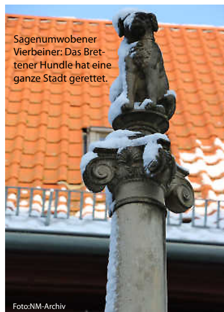
Sagenumwobener Vierbeiner: Das Brettener Hundle hat eine ganze Stadt gerettet.

Und da wäre noch die Geschichte vom Hexenbiss am Heidelberger Schloss, das älteste Musikinstrument der Welt oder auch die Antwort auf die wichtige Frage, warum Badener auch als „Gelbfüßler“ bezeichnet werden. Diese und noch viele andere spannende Anekdoten und Legenden zeigt unsere Rubrik „Unnützes Heimat-Wissen“ auf. (haf)