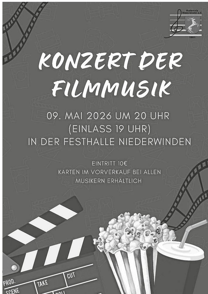
Plakat: Musikverein Niederwinden