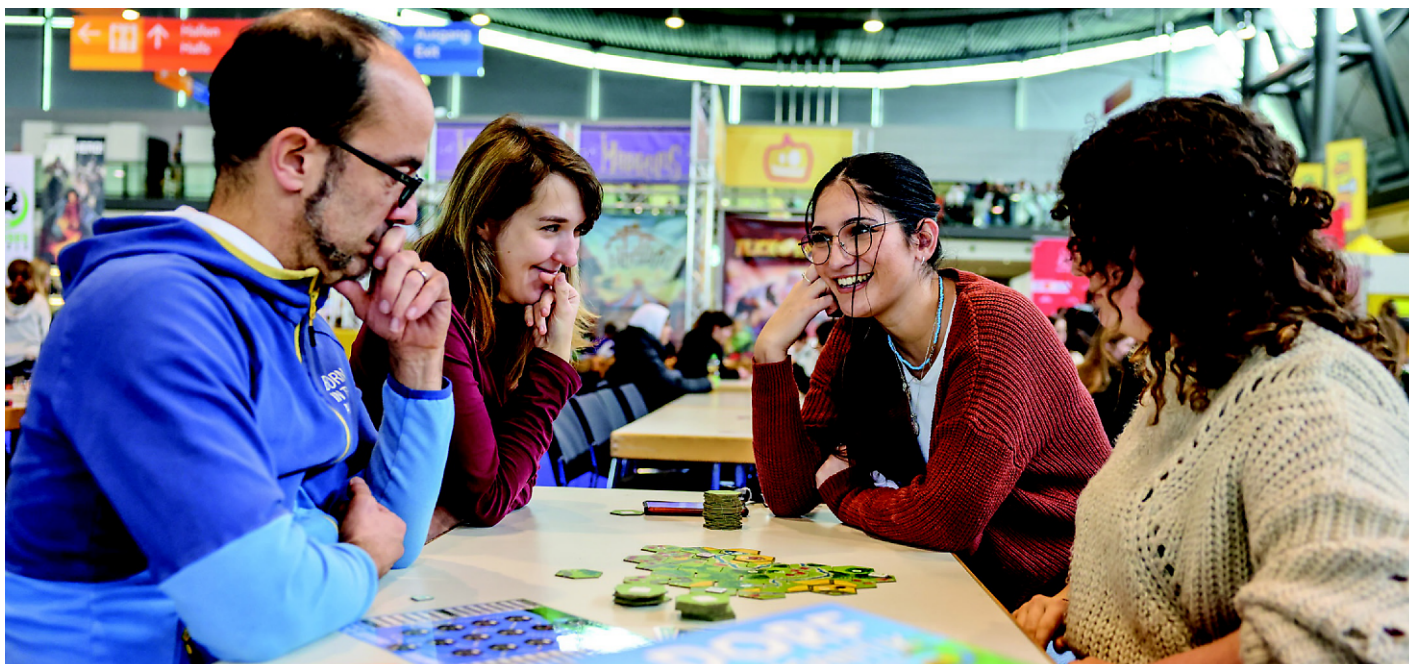
Neue Brettspiele entdecken und ausprobieren auf der Spielmesse