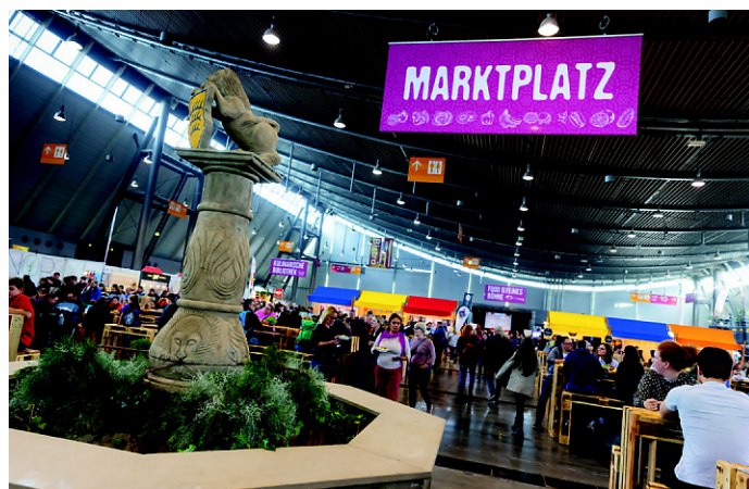
Schlemmen rund um den Marktplatz auf der FOOD UND FEINES

Festliche Tafeln, feine Düfte, köstliche Entdeckungen – die FOOD UND FEINES lädt zum Schlemmen, Staunen und Shoppen ein. In der neuen Sonderschau „Der gedeckte Tisch“ dreht sich alles um stilvolles Ambiente: Kunstvoll inszenierte Tafeln, edles Geschirr und geschmackvolle