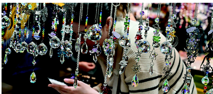
Es glitzert und funkelt auf der KREATIV

Selbstgemacht ist Trumpf! Auf der KREATIV warten unzählige Materialien, Werkzeuge und Ideen für DIY-Projekte – perfekt für alle, die in der Adventszeit basteln, handarbeiten oder dekorieren möchten. In über 200 Workshops heißt es: Mitmachen und Neues lernen.