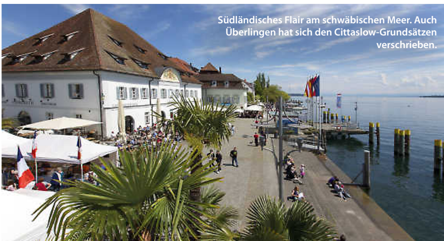
Südländisches Flair am schwäbischen Meer. Auch Überlingen hat sich den Cittaslow-Grundsätzen verschrieben.

Bad Schussenried liegt im Herzen Oberschwabens, zwischen Ulm und Ravensburg, im Landkreis Biberach, nicht weit vom Bodensee entfernt. Auch hier wird Langsamkeit bewusst zelebriert. (ral/red)