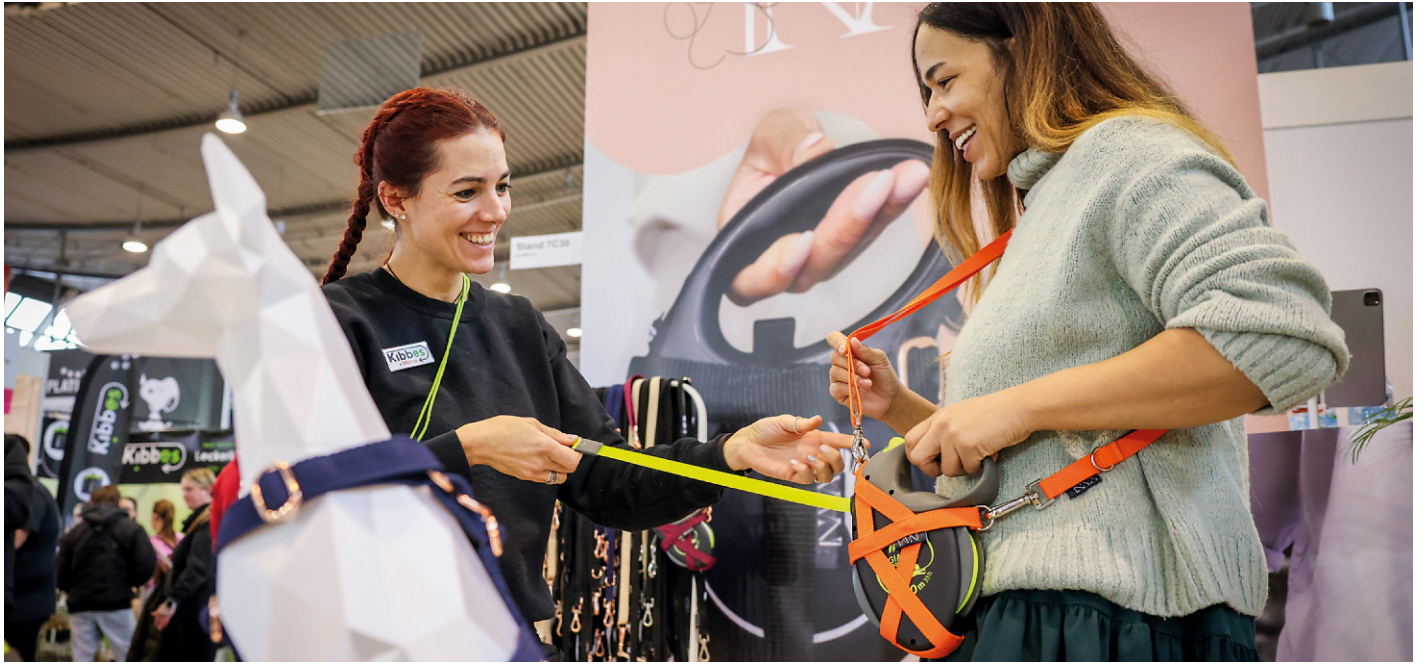
Zubehör für den vierbeinigen Liebling shoppen auf der ANIMAL