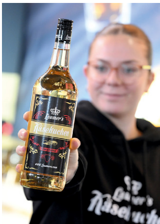
Ausgefallene Mitbringsel von der Familie & Heim – Käsekuchen aus der Flasche

Die Spielemesse ist ein Paradies für Groß und Klein. Neue Brettspiele testen, mit VR-Brille in digitale Welten abtauchen oder Roboter programmieren – hier wird gespielt, gebaut und ausprobiert.