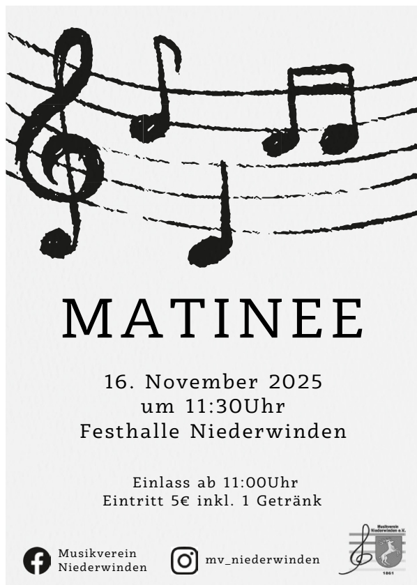
Plakat: Musikverein Niederwinden

Am Sonntag, dem 16.11.2025, laden wir zu unserer Matinee in der Festhalle Niederwinden ein. Beginn ist 11:30 Uhr, der Einlass startet ab 11 Uhr. Eintritt 5 € inklusive eines Getränks. Wir freuen uns auf Ihren Besuch!