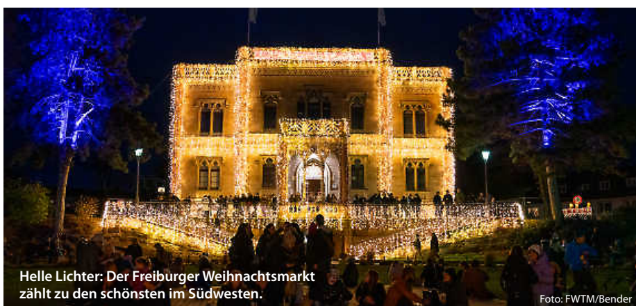
Helle Lichter: Der Freiburger Weihnachtsmarkt zählt zu den schönsten im Südwesten.

Oder kleine, liebevoll inszenierte Adventsmärkte in stimmungsvoller Kulisse, zum Beispiel im Maulbronner Klosterhof zum 2. Advent, der Adventsmarkt im Bruchsaler Schlosshof unter der erleuchteten Schlossfassade oder der Durlacher Mittelalter-Weihnachtsmarkt. Ein Besuch lohnt sich ... (jr/uw/red)